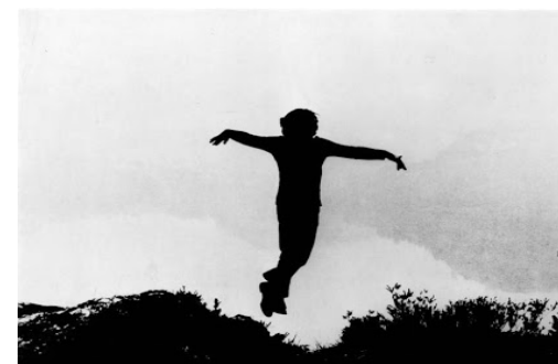
Tentativo di volo - Gino De Dominicis still video_ 1969