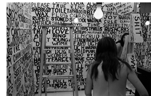
Words - Alan Kaprow installazione_happening_ 1962