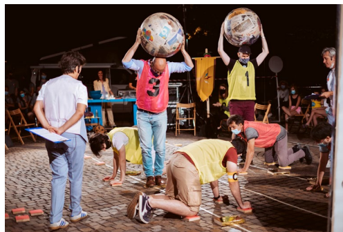
Radio Olimpia Bomba liberi tutti! 2020 _ Pergine Festival