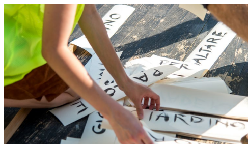
Radio Olimpia Bomba liberi tutti! 2020 _ Camspirago_ Esperidi On the Moon