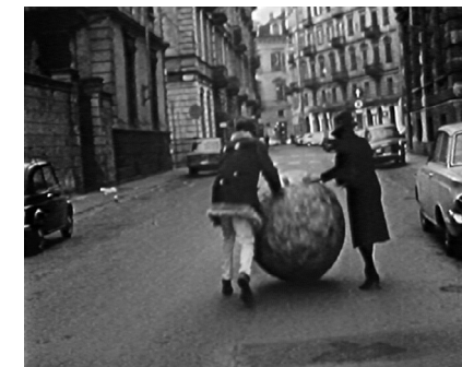
Sfera di giornali - Michelangelo Pistoletto Performance_ Torino 1967